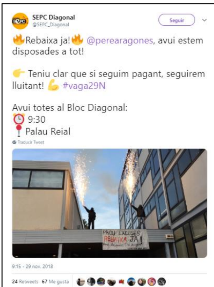
Il·lustració V. https://twitter.com/SEPC_Diagonal/status/1068040658269728770