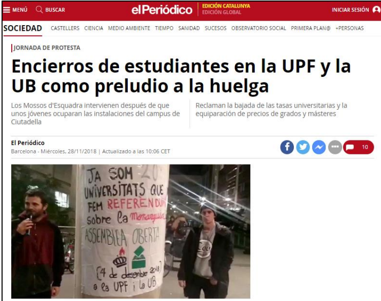
Il·lustració I. https://www.elperiodico.com/es/sociedad/20181128/encierro-estudiantes-huelga-universidades-7171921

A continuació adjuntem diferents imatges que posen de manifest els aspectes descrits anteriorment: