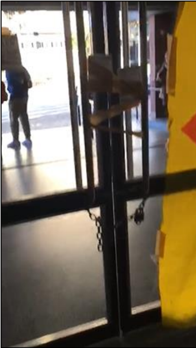
Il·lustració III. Elaboració pròpia.