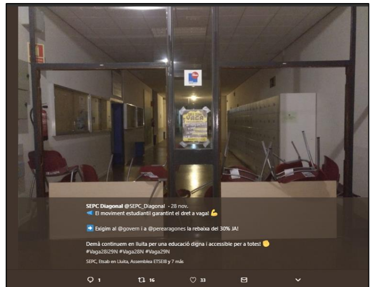
Il·lustració VI. https://twitter.com/SEPC_Diagonal/status/1067709542333628417