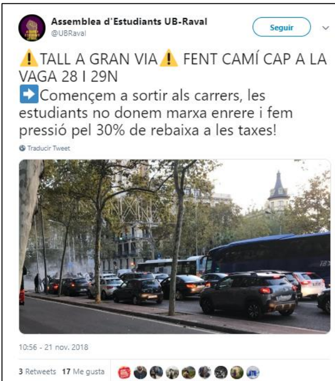
Il·lustració II. https://twitter.com/UBRaval/status/1065167116788092928