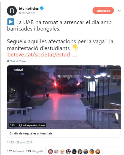
Il·lustració III. https://twitter.com/btvnoticies/status/1068075350020800512