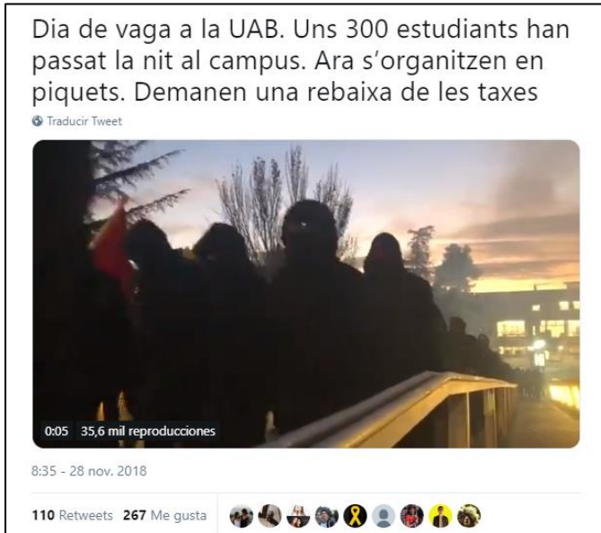
Il·lustració I. https://twitter.com/miqueljarque/status/1067668204913340416

Gent encaputxada pel recinte del campus universitari: