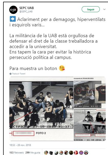
Il·lustració IV. https://twitter.com/SEPC_UAB/status/1067793557313003520