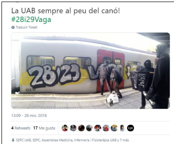
Il·lustració XVI.