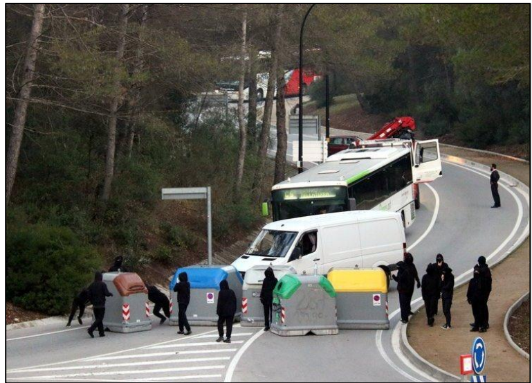
Il·lustració VI.