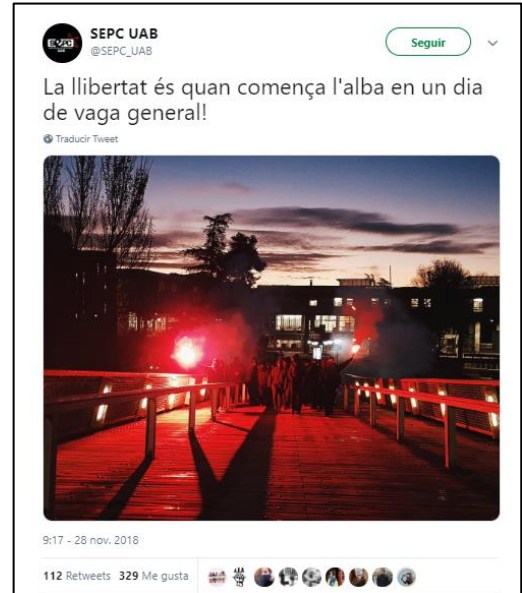
Il·lustració II.