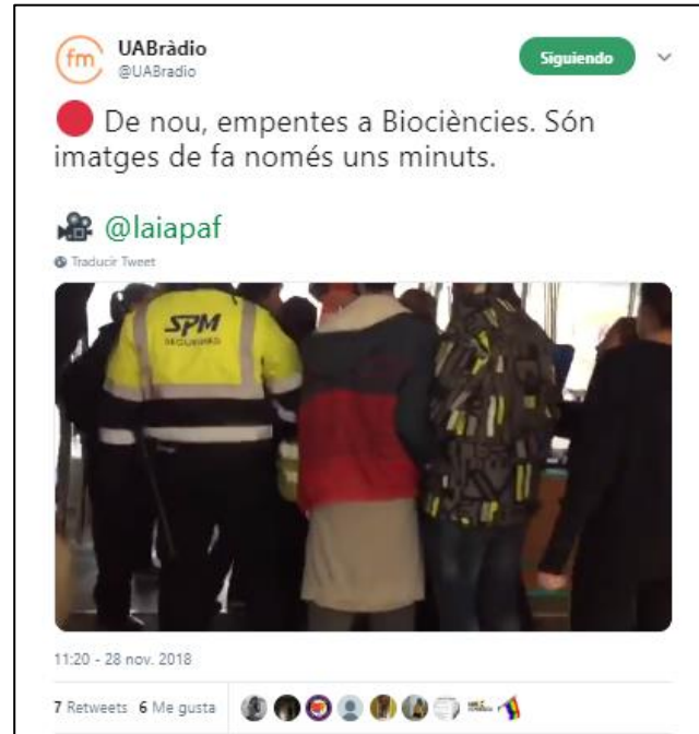
Il·lustració XV. https://twitter.com/UABradio/status/1067709818776023040