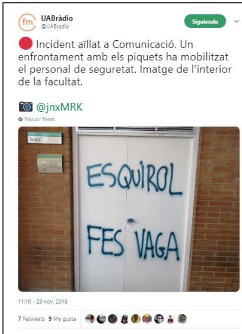
Il·lustració XIV. https://twitter.com/UABradio/status/1067708849757540353