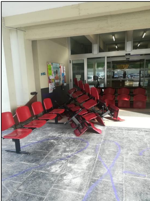
Il·lustració X. Elaboració pròpia

https://twitter.com/diariARA/status/1067688193645035521