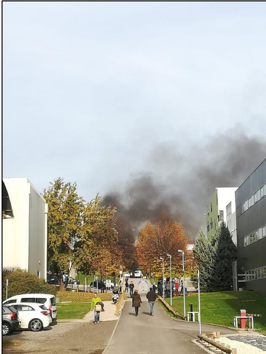
Il·lustració XI. Elaboració pròpia