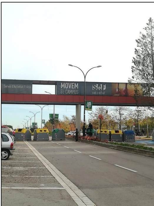
Il·lustració VII. Elaboració pròpia