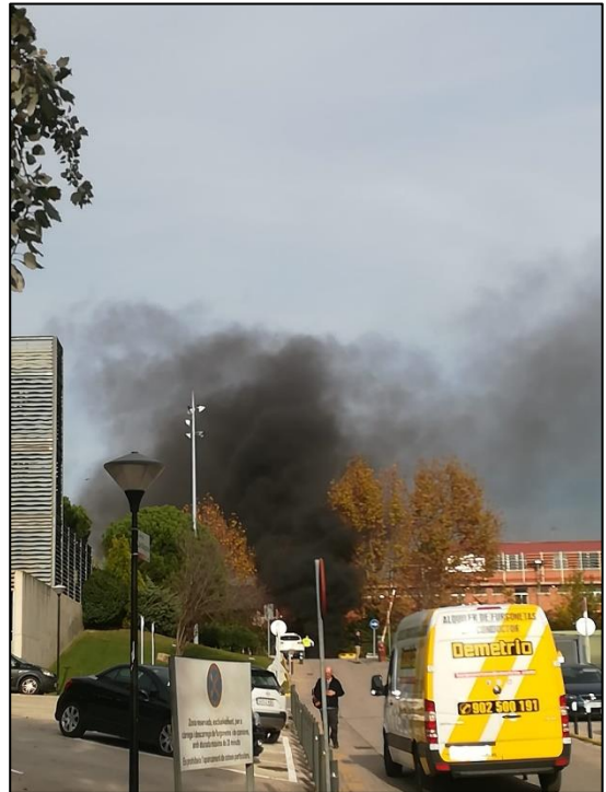
Il·lustració XII. Elaboració pròpia