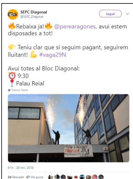
Il·lustració V. https://twitter.com/SEPC_Diagonal/status/1068040658269728770