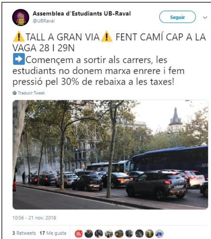
Il·lustració II. https://twitter.com/UBRaval/status/1065167116788092928