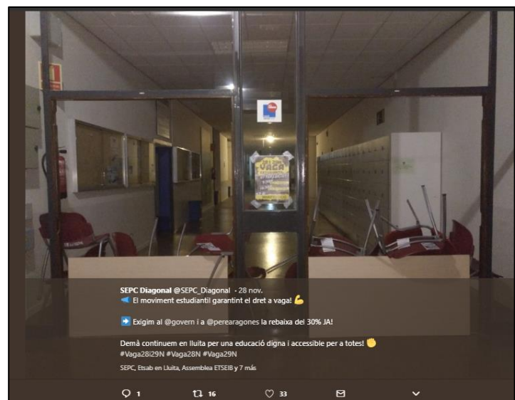
Il·lustració VI. https://twitter.com/SEPC_Diagonal/status/1067709542333628417