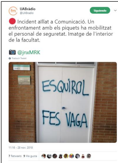
Il·lustració XIV. https://twitter.com/UABradio/status/1067708849757540353