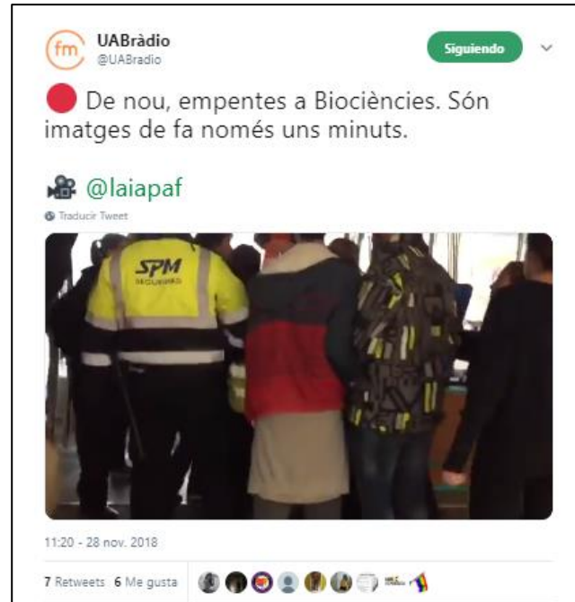
Il·lustració XV. https://twitter.com/UABradio/status/1067709818776023040