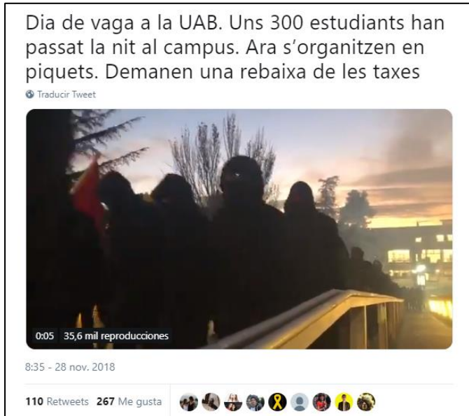
Il·lustració I.

Gent encaputxada pel recinte del campus universitari: