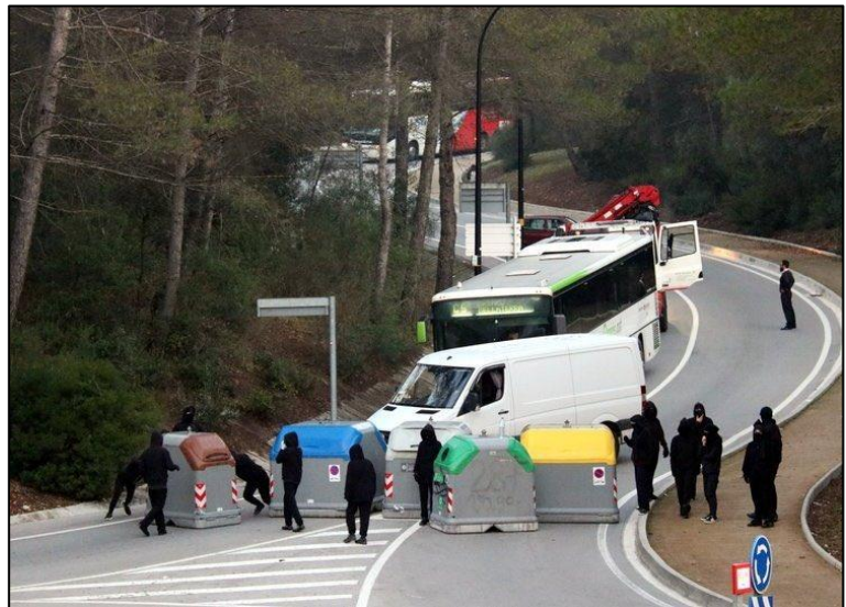
Il·lustració VI.