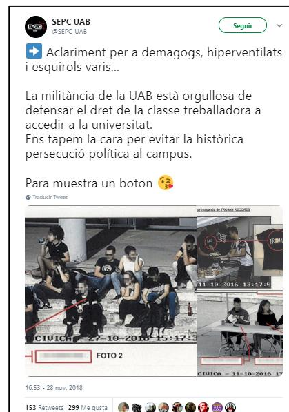
Il·lustració IV. https://twitter.com/SEPC_UAB/status/1067793557313003520