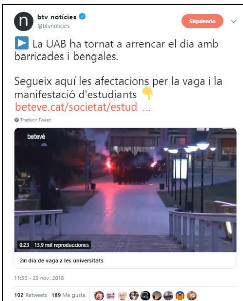
Il·lustració III. https://twitter.com/btvnoticies/status/1068075350020800512