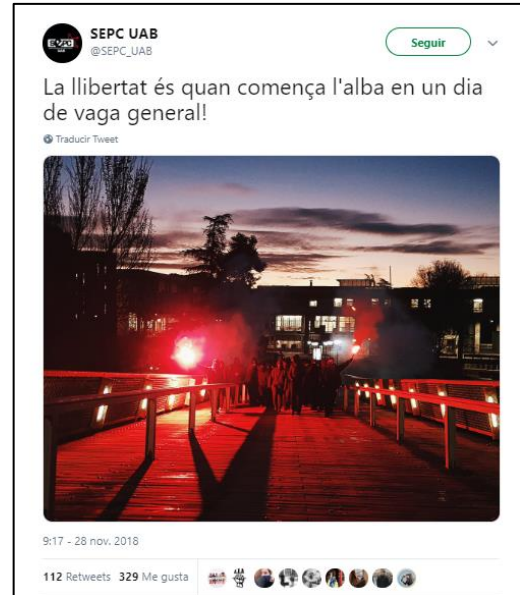
Il·lustració II. https://twitter.com/SEPC_UAB/status/1067678859728953344