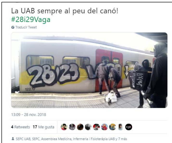
Il·lustració XVI.