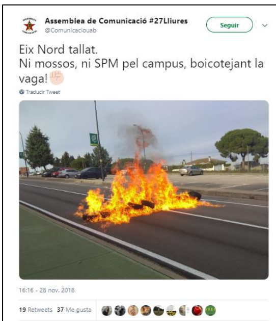
Il·lustració XIII. https://twitter.com/Comunicaciouab/status/1067784328837500928