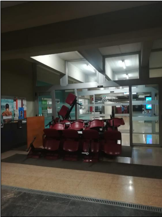
Il·lustració VIII. Elaboració pròpia

Utilització de material de la Universitat per a impedir els accessos a les facultats: